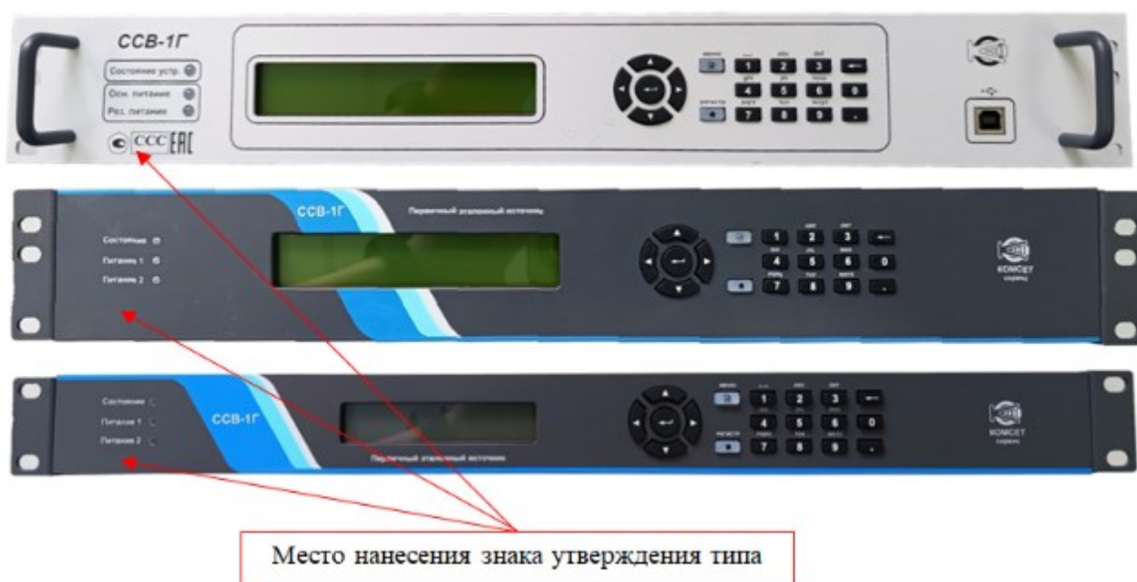
Рисунок 2 – Передняя панель сервера синхронизации времени ПЭИ ССВ-1Г