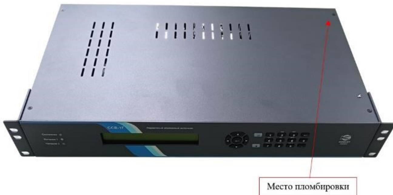
Рисунок 1 – Внешний вид сервера синхронизации времени ПЭИ ССВ-1Г и место пломбировки

Внешний вид ССВ с указанием мест пломбирования и нанесения знака утверждения типа и заводского номера приведен на рисунках 1, 2, 3.